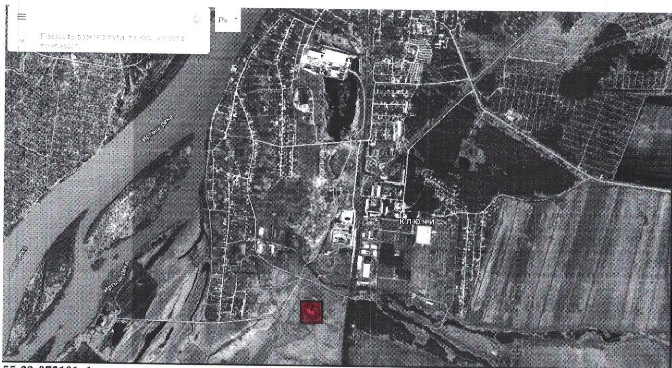
Схема расположения места сжигания мусора